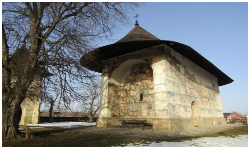
Biserica „Tăierea Capului Sf. Ioan Botezătorul” Arbore

De-a lungul ultimelor cinci-șase veacuri, nordul moldav a avut două civilizații rurale distincte, cea răzeșească și cea iobăgească, ambele puternic influențate de civilizația meșteșugărească urbană, preponderent armenescă, germanică, maghiară și țigănească. Răzeșii, începând cu voievodul și terminând cu proprietarul celei mai mici fâșii de pământ, erau valahi, cu obiceiuri distincte și exclusiviste, cu un port nealterat decât de contaminări nobiliare polone. Ei dispar din istorie, la cererea lor, abia după anul 1864, când Dieta Bucovinei le aprobă cererea de a fi considerați țărani, cu beneficiul păstrării unui fecior bun de recrutare pe lângă casă, pentru a se ocupa de gospodărie.