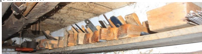
Raftul cu rindele al unui tâmplar din Văleni

Tâmplăria este un meșteșug diferențiat și bine specializat, desprins de dulgherie. Ca meșteșug al prelucrării lemnului, tâmplăria a apărut și s-a dezvoltat în târguri și în orașe, de unde a trecut și la sate, în primul rând în satele din apropierea orașelor. Existau meșteri mai talentați care lucrau frumoase lăzi de zestre, colțare, blidare, mese și scaune, împodobite sumar cu creștături simbolice: rozeta, crucea, bradul, șarpele, zimții etc. Aceste piese de mobilier, cu o amplasare strictă în interiorul casei tradiționale au fost treptat eliminate și înlocuite cu mobilierul modern. Unii lemnari din sate s-au specializat în producerea obiectelor mărunte de uz casnic și gospodăresc, ajungând chiar la stricte diferențieri: lingurari, fusari, covătari, spătari, coșărcari etc. Lingurăritul este specific, spre exemplu, satului Țolici, dezvoltându-se puternic în zona comunei și în alte sate.