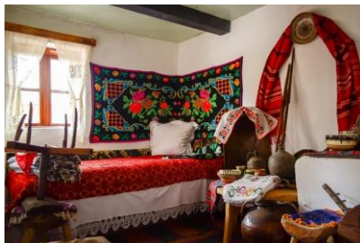
Interioare țărănești - comuna Bălăbănești

Zona de sud a Moldovei este una bogată din punct de vedere etnografic și folcloric. Tradițiile, obiceiurile de peste an și cele care însoțesc riturile de trecere (nașterea, nunta, înmormântarea), bogatul repertoriu de cântece epice și lirice, de proză populară, dramaturgia, proverbele și zicătorile din cadrul zonei dau autenticitate zonei. Folclorul din zona noastră reflectă viața, munca, frământările oamenilor, căutările, bucuriile, durerile și aspirațiile acestora. Viața agitată din apropierea Dunării a avut influență și asupra acestor aspecte,