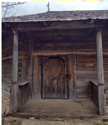
Intrare Biserică de lemn Păușești, com. Dumești

Teritoriul GAL „Stejarii Argintii” este format din 6 comune: Miroslava (cu satele: Miroslava, Balciu, Găureni, Uricani, Valea Ursului, Vorovești, Brătuleni, Dancaș, Cornești, Proselnici, Horpaz, Ciurbești, Valea Adâncă), Lețcani (cu satele: Lețcani, Cucuteni, Cogeasca, Bogonos), Dumești (cu satele: Dumești, Păușești, Banu, Chilișoiaia, Hoisești), Horlești (cu satele: Horlești, Bogdănești, Scoposeni), Popești (cu satele: Popești, Obrijeni, Doroșcani, Hărpășești, Vama) și Mădârjac (cu satele: Mădârjac, Bojila, Frumușica).