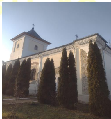
Biserica Popești, com. Dumești