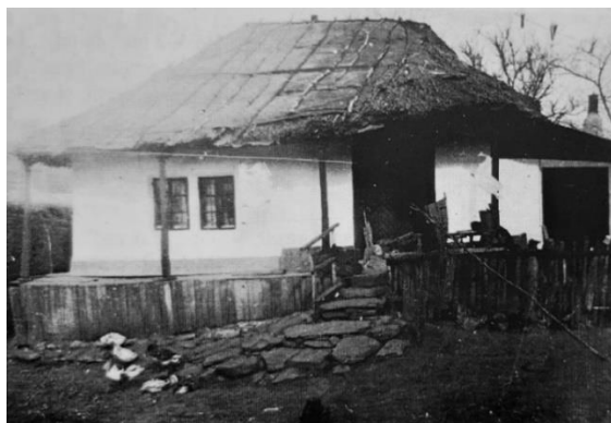
Casă din Vutcani, cu odae și tindă, la care s-a adăugat chilerul; foto: Doina Rotaru, anii 1980, (sursa: Habitatul, vol. IV, Moldova, Ed. Etnologică, București, 2017, p. 245)

Portul popular. Nu există un port popular ca marcă identitară a județului Vaslui. Din cauza unor condiții istorice specifice, această zonă a devenit reprezentativă tocmai printr-o diversitate de elemente ale culturii populare, în vechime fiind expusă atât năvălirilor turcești și, mai ales tătărești, apoi teatru de luptă al războaielor dintre turci și ruși, cât și epidemiilor. Toate acestea au determinat importante mișcări de populație, lipsa mâinii de lucru ducând la necesitatea unor colonizări, la care se adăuga și transhumanța.