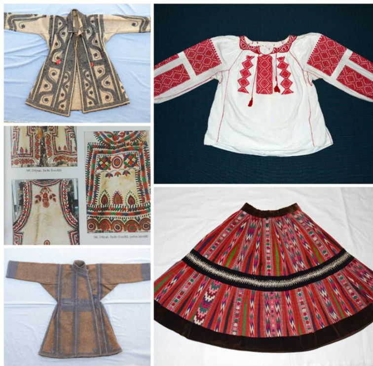
Costume de Răzeși din colecția Muzeului de Etnografie din Bacău

Urminișul, Verseștii , „dar răzeșii, adică părtașii, nu sunt doar micii proprietari, uneori mazili, ci și boieri și mănăstiri” Erau multe sate răzeșești în acest secol XIX în județul Bacău; între acestea și unele care fac obiectul studiului nostru din GAL Ulmus Montana: Bereștii , G(r)ligoreni , Leontineștii , Măgirești , Stăneștii , Prăjeștii... , Bucșeștii , Cernul , Vășieștii - sate învecinate de pe Valea Tazlăului Sărat. Starea materială a acestor răzeși era bună, erau gospodari și primitori.