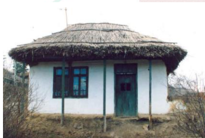
Locuință tradițională Suceveni

Din punct de vedere al specificului locuințelor , acestea sunt caracteristice zonelor de deal. În timpurile îndepărtate a cunoscut o mare răspândire locuința cu o singură încăpere, iar cea cu două încăperi – odaia de locuit și chilerul (tinda) se generalizează abia la sfârșitul secolului al XIX-lea. Întreaga activitate se desfășura în odaia de locuit care avea rol de dormitor, sufragerie și bucătărie.