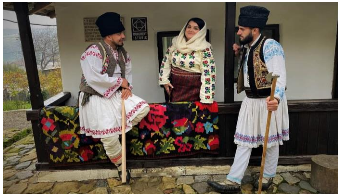
Tineri din Trifești în costume tradiționale în fața unei case-muzeu a familiei Lehonschi

Așa cum am remarcat de-a lungul acestui studiu, Ținutul Răzeșilor poate deveni o alternativă mult mai viabilă pentru turism decât este în acest moment. O alternativă pentru turismul cultural, pentru turismul concentrat pe cultura tradițională a comunităților care descind din micii proprietari de pământ numiți din Evul Mediu răzeși. Ținutul are multe de oferit din punct de vedere turistic. În afara infrastructurii care are nevoie de reabilitări majore, a serviciilor și a spațiilor de cazare insuficient pregătite, turistul sau pelerinul are nevoie de informațiile care să-l ghideze în sejurul său, care să-i îndrume pașii prin sate pentru a putea descoperi arhitectura, arta populară, gastronomia, tradițiile de sărbători, cele dedicate marilor momente din viața omului etc. Ținutul Răzeșilor are nevoie de un astfel de proiect, atât de varianta sa clasică, cât și de varianta digitalizată, în ton cu vremurile. Acest studiu poate reprezenta baza informativă pentru broșuri, pentru traseele excursiilor tematice și pentru identificarea obiectivelor care trebuie vizitate.