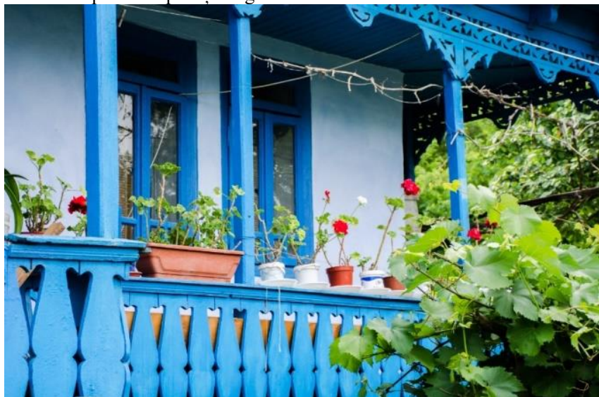
Casă din Lipovăț, anii 1960, detaliu

Gospodăria cuprindea grădina și ograda sau siliștea casei (prin siliște înțelegându-se întreaga gospodărie, locul din vatra satului pe care se putea construi o casă). La oarecare distanță de uliță, în ogradă sau curte se afla casa cu: tindă la mijloc, două odăi, chiler (încăpere construită pe partea laterală a casei, lângă una dintre odăi), cerdac, prispă cu parmaclâc și deregi; în spate se afla alt chiler pentru cuptor și magazie.