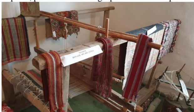
Stative din Dragomirești

Țesutul manual, în stative și război, este o ocupație exclusivă a femeilor, a cărei perenitate este simțită din plin. A fost favorizat de cultivarea cânepii, inului și mai târziu de creșterea oilor. Țesutul manual oferea posibilitatea confecționării îmbrăcăminte textile, dar și a covoarelor ce decorau pereții caselor. Această îndeletnicire a avut un caracter permanent uneori, alteleori un caracter temporar, practicându-se de gospodine numai în perioada de iarnă.